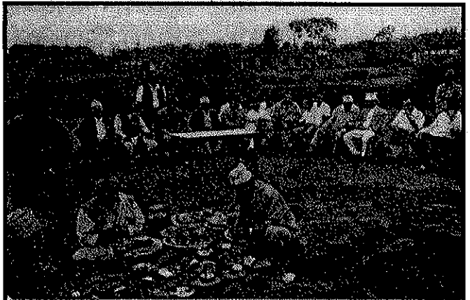
केन्द्रीय भवन शिलान्यास समारोह गोठार काठमाडौंको एक झलक