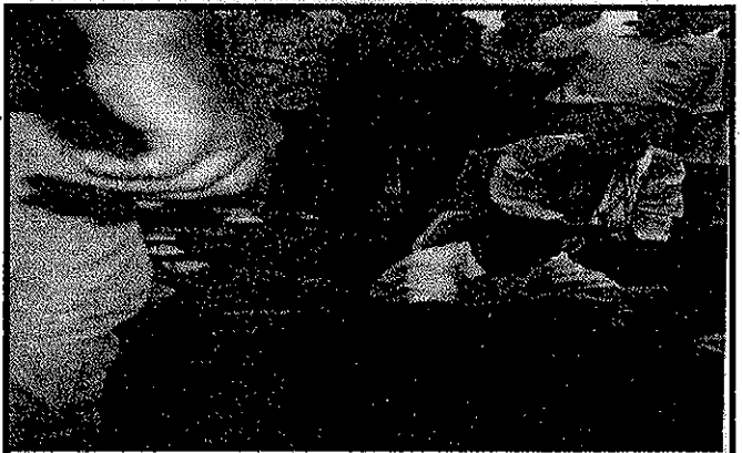
केन्द्रीय भवन शिलान्यास समारोह गोठार काठमाडौंको एक झलक